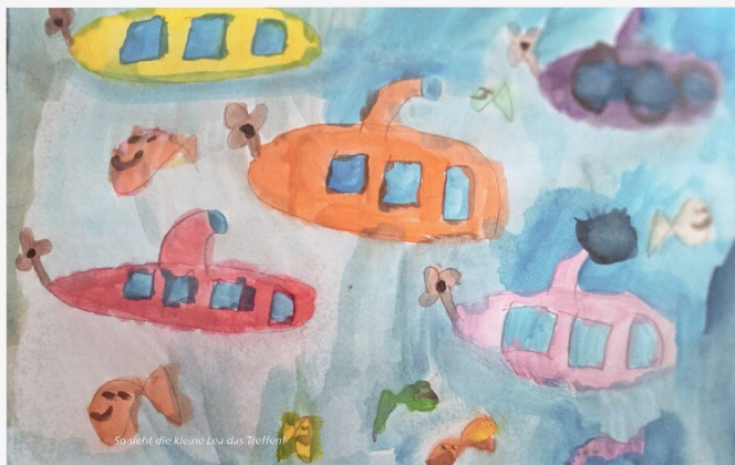
So sieht die kleine Lea das Treffen