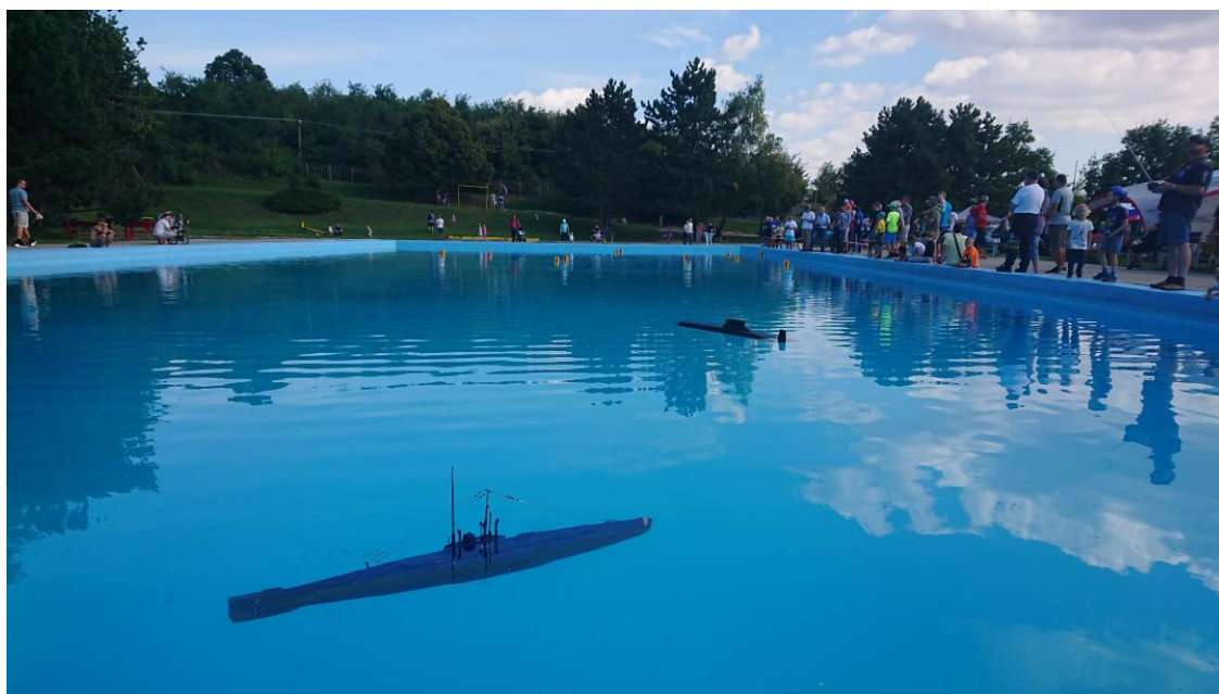
Miesto stretnutia - areál letného kúpaliska Bratislava – Rača